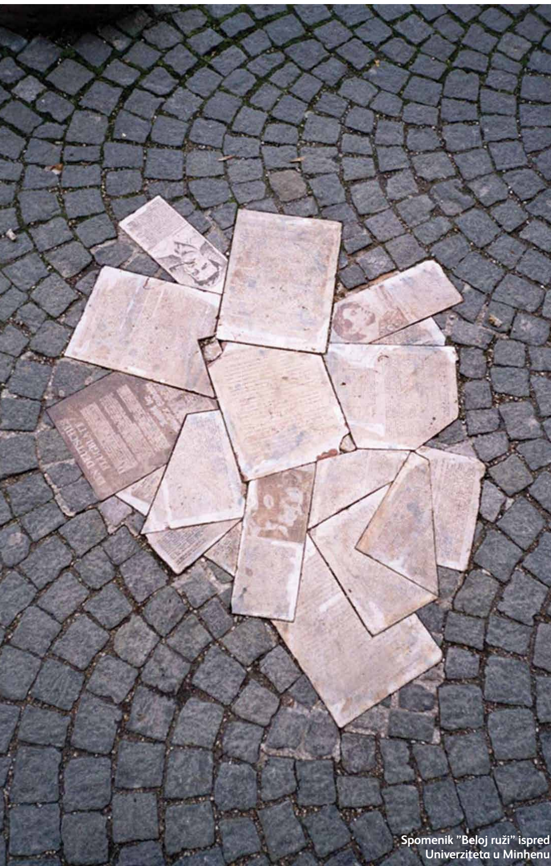
Spomenik "Beloj ruži" ispred Univerziteta u Minhenu

kolega i prijatelja koji su se okupljali u kružoku nazvanom "Bela ruža". Danas je "Bela ruža", "Weisse Rose", pojam prosvetljenog i nenasilnog otpora, ali je ona u suštini mnogo više. Grupa "Bela ruža" je iskupljenje nemačkog jezika. Mladi ljudi vođeni mekom rukom svog profesora uspeli su da sačuvaju vatru nemačke kulture pred nasilnim ludilom koje je bilo inficiralo ceo svet.