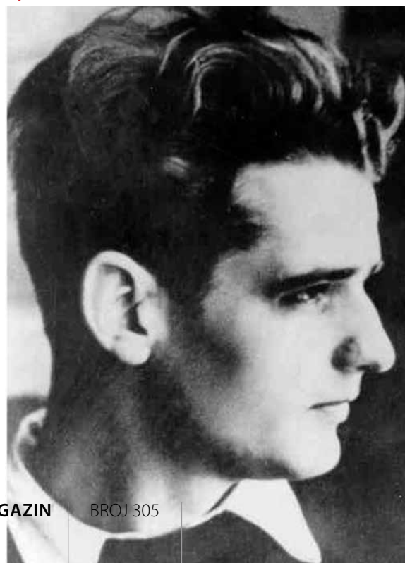
▼ Hans Šol

ponaša tako apatično prema ovom jezivom, čoveka nedostojnom zločinu?" U trećem letku Hans Šol i Aleksandar Šmorel daju praktične savete kako da svaki građanin da doprinos rušenju Hitlerovog režima: "Sabotaža u fabrikama oružja, sabotaža pri svim skupovima, partijskim okupljanjima, proslavama, organizacijama, svemu što nacionalsocijalisti organizuju i predvođe. Sabotaža u naučnim i duhovnim oblastima koje su se stavile u službu vođenja rata."